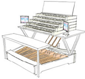
Esquisse de la future console mobile