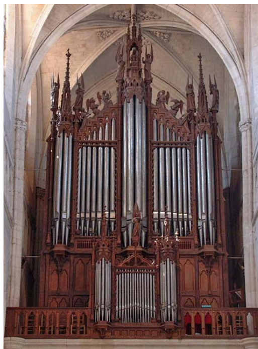
Luçon Cavaillé-Coll 1855, Schwenkedel 1968