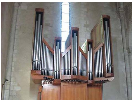
Mareuil-sur-Lay Oberthur 1988