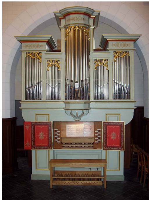
St-Aignan-de-Grand-Lieu Londe 2000