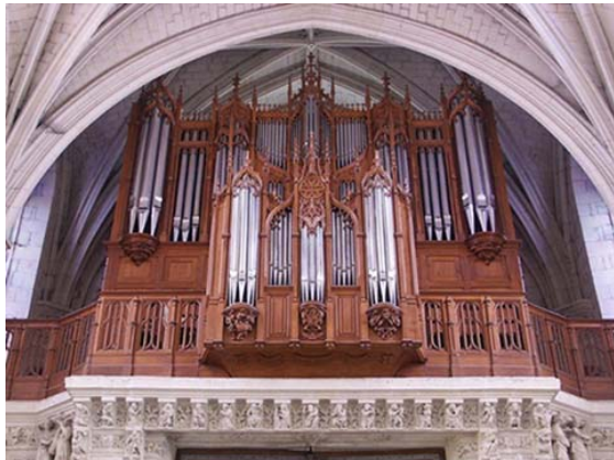
Beaufort-en-Vallée Manufacture Languedocienne de Grandes Orgues 1992